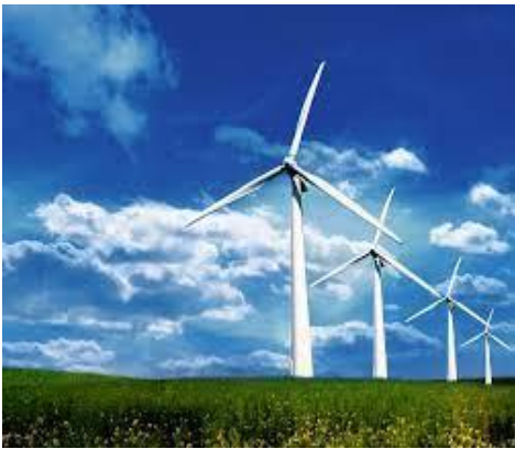
กังหันลม