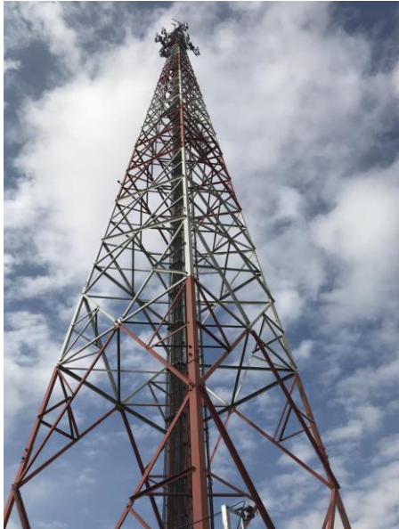
เสาส่งสัญญาณอินเทอร์เน็ต