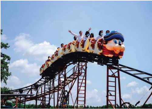
เครื่องเล่นในสวนสนุก