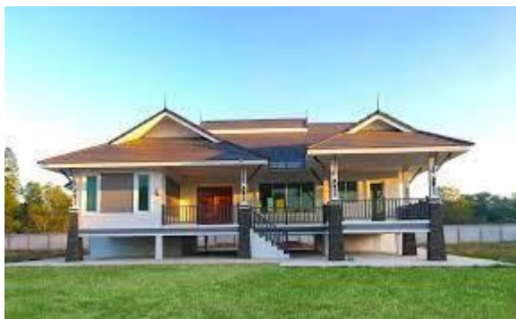
บ้านเดี่ยว