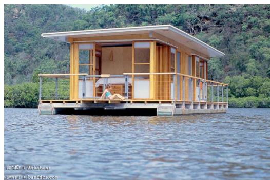
บ้านเรือนแพ