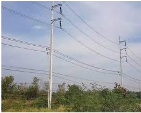
เสาไฟฟ้า