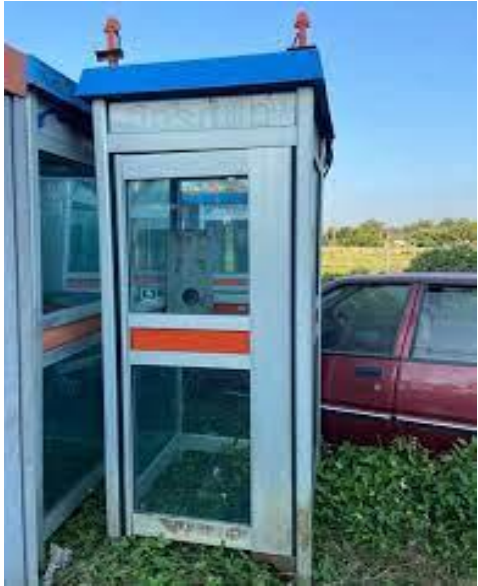
ตู้โทรศัพท์สาธารณะ