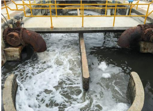
บำบัดน้ำเสีย