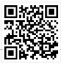
Scan QR เพื่อ Download