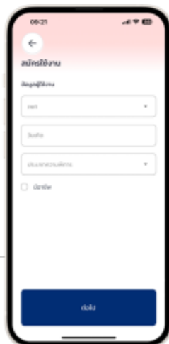
7. เลือกข้อมูลผู้ใช้งานเมื่อเลือกเสร็จให้กด "ต่อไป"