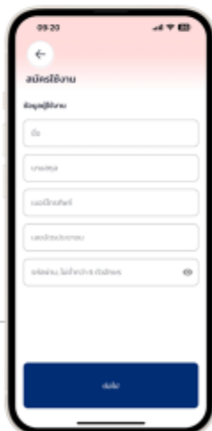
6. กรอกข้อมูลผู้ใช้งานเมื่อกรอกเสร็จให้กด "ต่อไป"