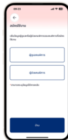
9. เพิ่มข้อมูลผู้ดูแลหรือผู้ช่วย สามารถกด "ข้าม" เพื่อกรอกภายหลัง