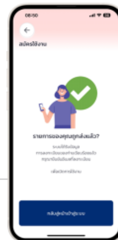
12. เข้าสู่บริการ NiNA 1479