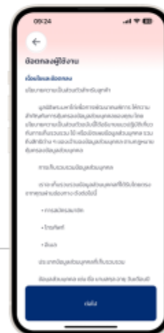
10. อ่านรายละเอียดเงื่อนไขและข้อตกลง กด "ต่อไป"