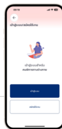
4. เลือก "สมัครใช้งาน"