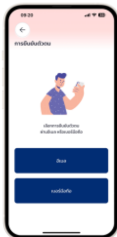
5. เลือกการยืนยันตัวตน (ถ้าเลือก "อีเมล" ต้องสามารถเข้าเมลเพื่อกดยืนยันได้)