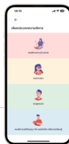
3. เลือกประเภท ความพิการ