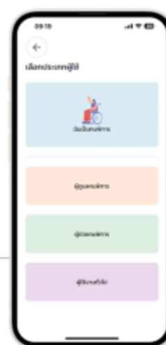
2. เลือกประเภทผู้ใช้