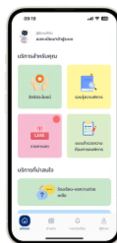
1. กด "ลงทะเบียน"