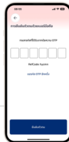
11. ยืนยันตัวตน (ถ้าเลือก "อีเมล" ต้องเข้าเมลแล้วกด "ยืนยันตัวตน")